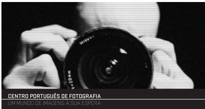
CENTRO PORTUGUÊS DE FOTOGRAFIA UM MUNDO DE IMAGENS À SUA ESPERA