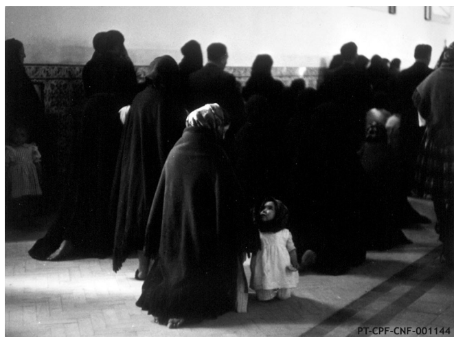
SABINE WEISS WEBER Intérieur d'église au Portugal 1954 PT/CPF/CNF/001144

Disponibilizamos via We Transfer um conjunto de imagens que fazem parte desta exposição com os respectivos créditos e legendas.